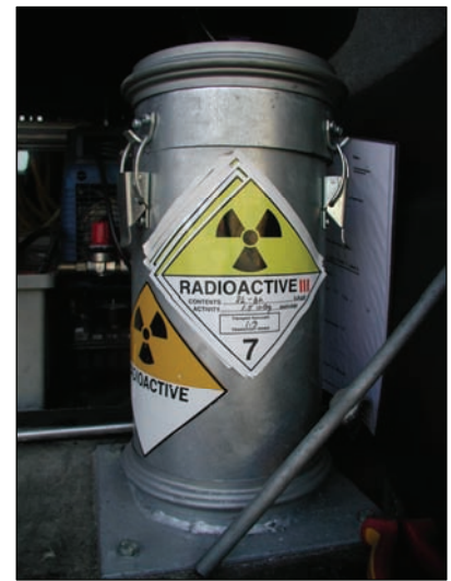
Figur 2. Korrekt afmærket læksøgerkøretøj og transportbeholder