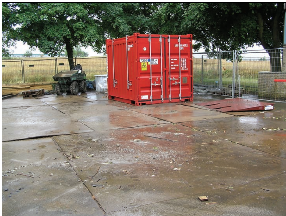
Figur 1 Radioaktivt affald fra nedbrydning af DR 1 reaktorblokken blev anbragt i ISO-containere inden det blev transporteret til oplagring på Dansk Dekommissionerings Mellemlager.

Dansk Dekommissionering har påbegyndt afviklingen af de nukleare anlæg på Risø-området og kun Behandlingsstationen for radioaktivt affald er endnu i drift. Ved udgangen af 2005 var forsøgsreaktor DR 1 fuldt afviklet og de øvrige anlæg: DR2, DR3, Hot Cells og Teknologihallen var forberedt for afvikling. Som det fremgår af tabel 3 i kapitel 5 forekommer der ikke længere transporter af brændsel eller uransilicid til eller fra anlæggene. I forbindelse med afviklingen af DR 1 er der gennemført et mindre antal transporter af radioaktivt bygningsaffald, der ikke kan frigives fra de nukleare tilsynsmyndigheders kontrol (Figur 1). Transporterne fandt sted på Risø-området fra DR 1 til Dansk Dekommissionerings mellemlager for radioaktivt affald.