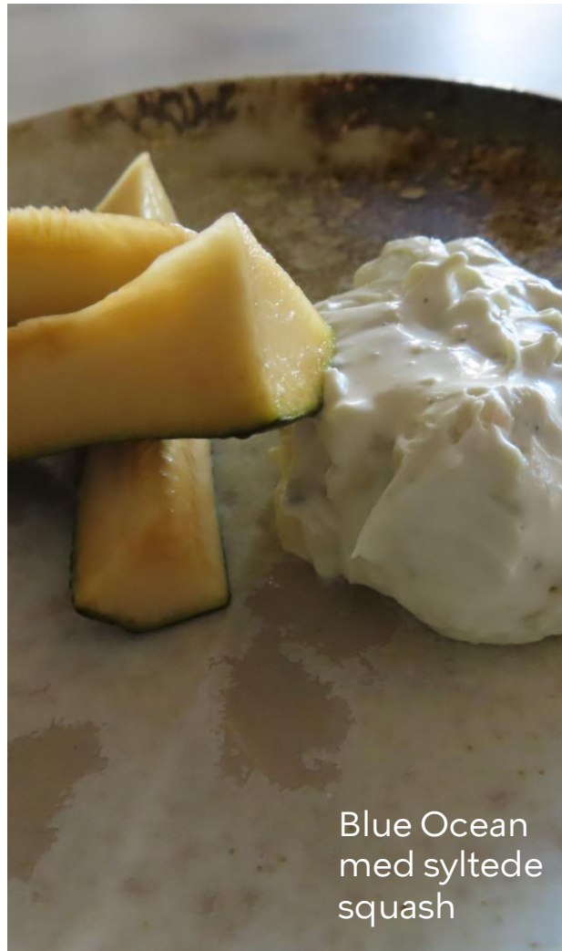
Blue Ocean med syltede squash