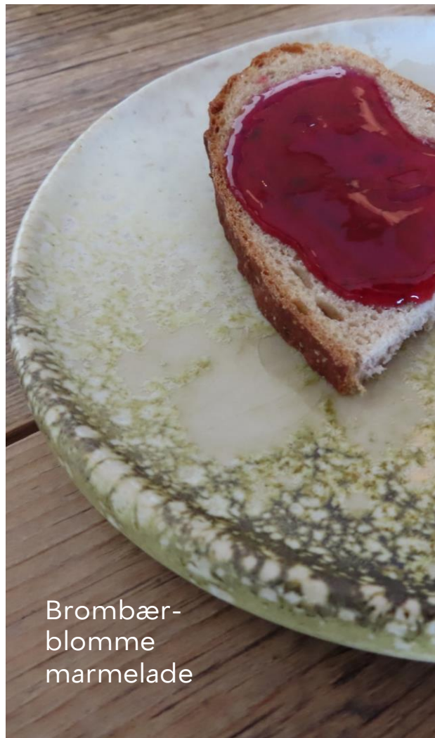
Brombær- blomme marmelade