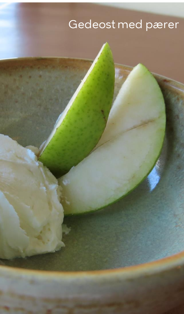
Gedeost med pærer