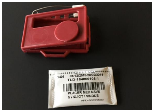
Figur 1. Plasticholder og dosimeterkort (helkrops-persondosimetret).

Dosimetret er i stand til at måle stråledoser forårsaget af ioniserende stråling (røntgen, gamma og betastråling). Doserne er bestemt ved dosisækvivalenterne H_p(10) og H_p(0,07) , der anvendes som mål for hhv. effektiv dosis og huddosis. Doserne angives i mSv (millisievert). Helkrops-persondosimetret består af et metalkort indeholdende strålefølsomt termoluminescens materiale. (TL-materiale). Metalkortet er indpakket i en speciel folie samt en holder af plastic, hvori kortet skal placeres under brug (se figur 1). Holderen er udformet med forskellige filtre, der gør det muligt at måle personens modtagne doser.