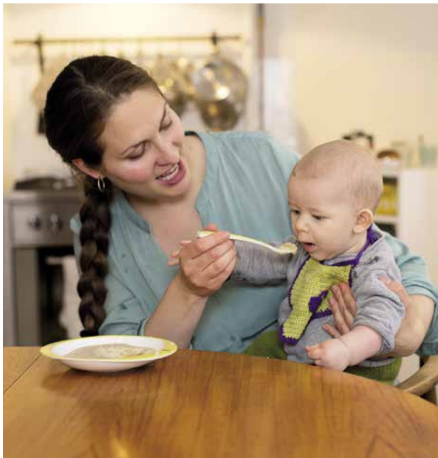
Hjemmelavet grød med lidt frugtmos er god at starte dagen på.

barn og fra måltid til måltid. Det kræver, at forældrene er opmærksomme, tålmodige og i stand til at aflæse spædbarnets signaler på om det fx er sultent, mæt, træt eller har brug for en pause som beskrevet i afsnit 2.1.1.