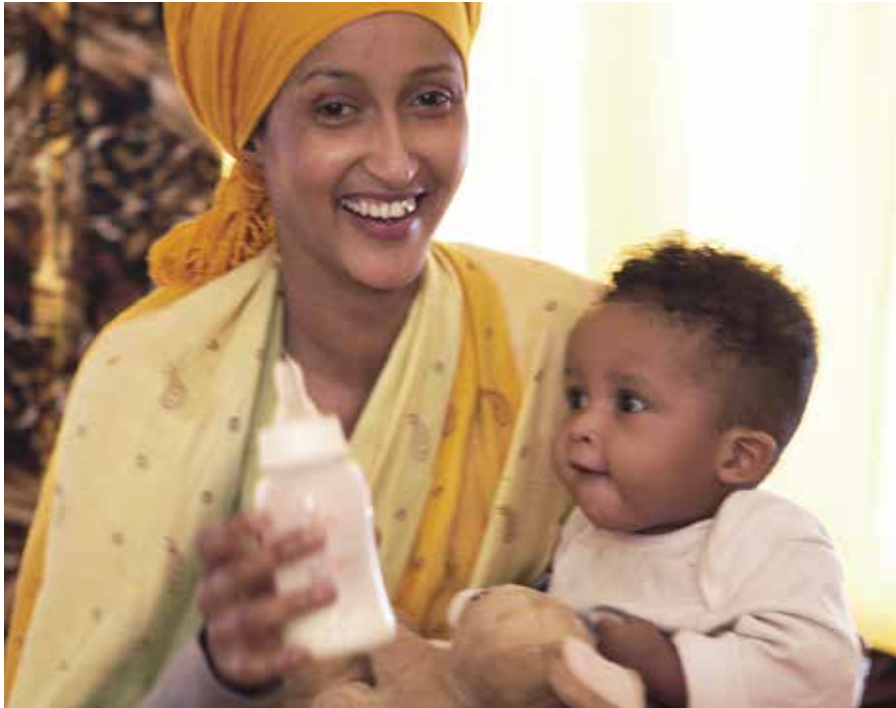
Overgangskosten suppleres her med modermælksersatning.

Det er en gængs opfattelse, at risstivelse i en mængde på 15 % af kulhydratet kan give større mæthedfølelse. Der foreligger ikke videnskabelig dokumentation for dette.